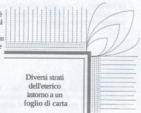
Diversi strati dell'eterico intorno a un foglio di carta

Quella che appare per prima è l'aura vitale, chiamata anche eterica. il suo aspetto è simile ad una nebbiolina grigio-bluastro, e il corpo vitale corrispondente è legato al secondo chakra. Rappresenta lo strato più denso delle auree, per questo, è la più facile da vedere. Questa aura è talmente vicina alla materia che ne possiede un gran numero di caratteristiche : forma, grana, compattezza; osservando il suo spessore e la sua densità, possiamo valutare la vitalità del corpo fisico. La visione dell'aura eterica permette in generale d'abituare lo sguardo alle altre auree e quindi di facilitare la percezione dell'aura astrale. I minerali e i vegetali dispongono solo dell'aura vitale. Per che non possano essere bloccati nella loro evoluzione, l'aura vitale comprende dentro di sé quattro strati che corrispondono a capacità svolte da corpi più sottili :